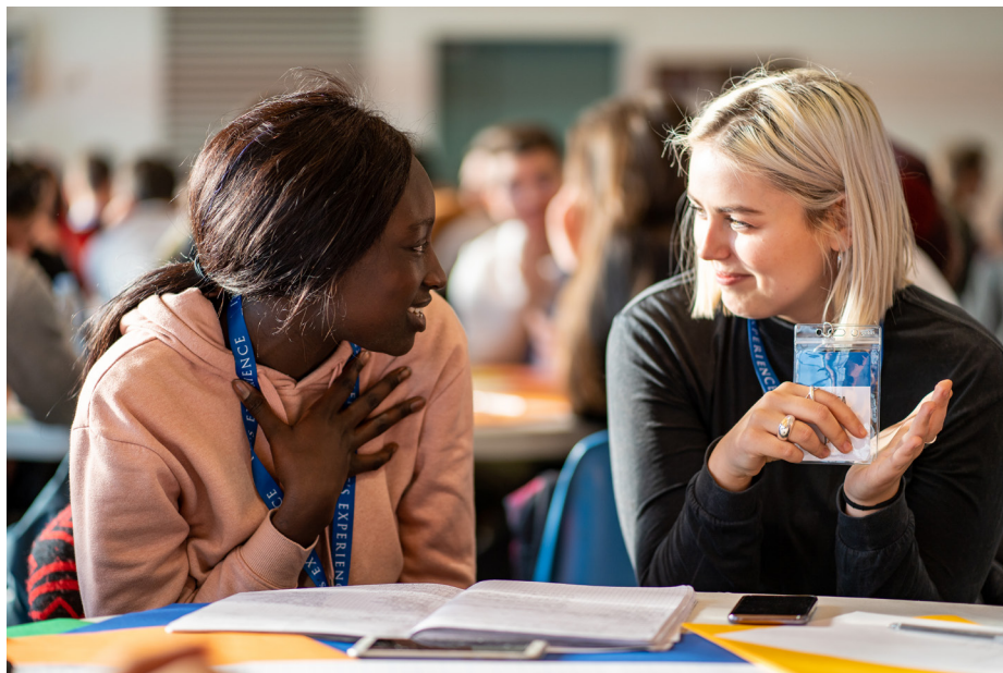
Workshop Estetica del lavoro 23-01-2020

Grazie infatti al profondo legame con il mondo delle aziende, oltre il 95% degli studenti ottiene un contratto di lavoro entro la fine del percorso.